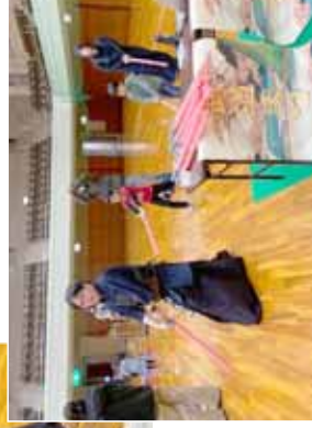
剣道エクササイズ