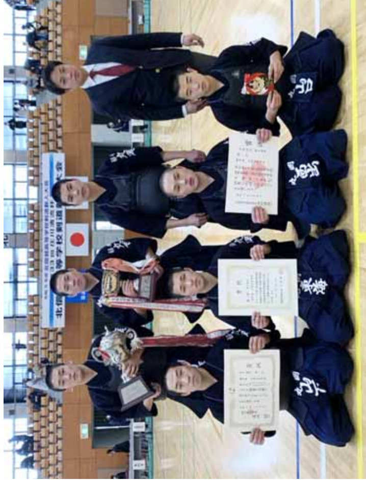
男子の部連覇の丸岡高校