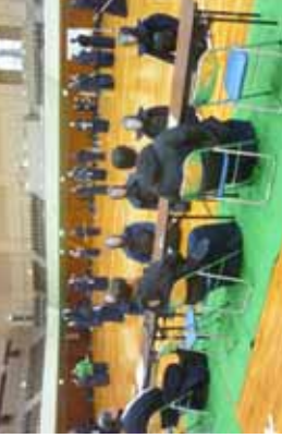
立ち合いの講評を聞く審査受講者②