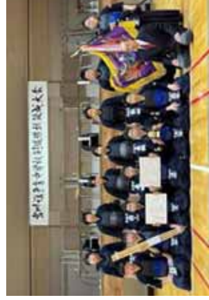
女子優勝、男子3位の鯉江中学校 (大阪府)