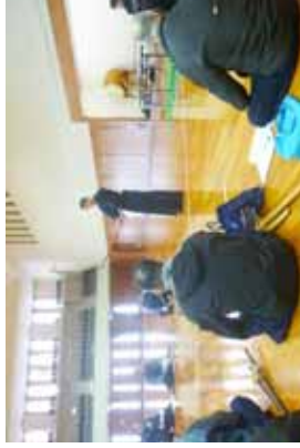
日本剣道形の講習②