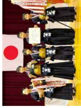
優勝の木田剣道スポーツ少年団A