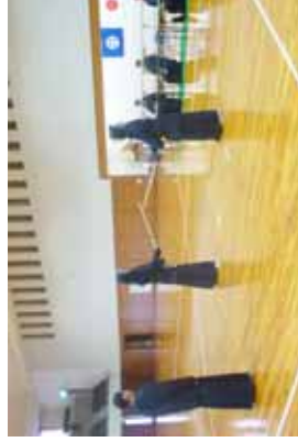
審査受講者による模擬立ち合いの様子③