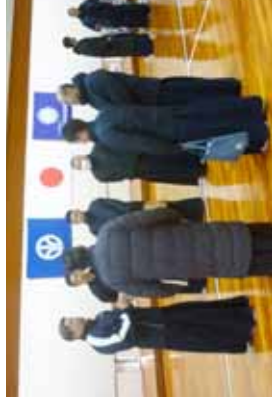
模擬審査の講評を聞く受講者