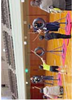
竹刀でタイヤ打ち③