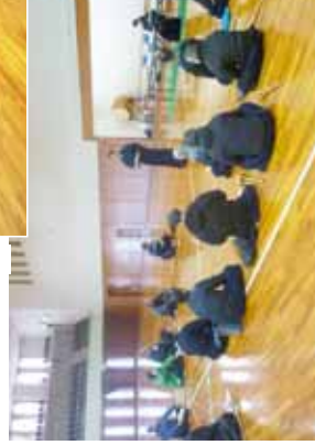
日本剣道形の講習①

今回は、本年10月6日(日)午後県立武道館で審査研修会(四段以上)を開催する予定です。皆様のご参加お待ちしております。