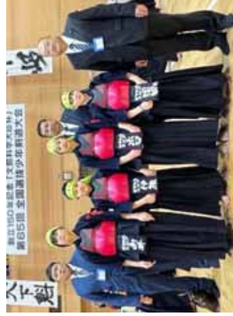
敦賀市剣道スポーツ少年団