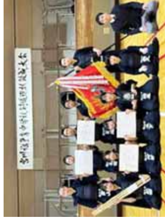
初優勝の松陵中学校