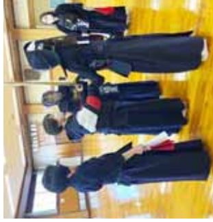
正しい鰐迫り合いの確認