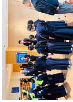
試合前に姉妹都市の水戸市の高橋市長と大津市議会議長から激励を受ける2チーム選手