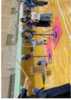
竹刀でタイヤ打ち①