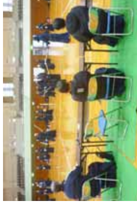
審査受講者による模擬立ち合いの様子①