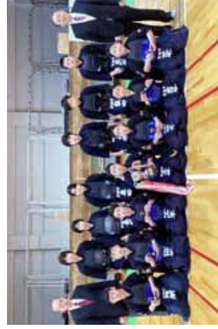
男子の部優勝の松陵中学校