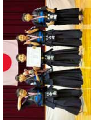
3位の芦原少年剣道教室A