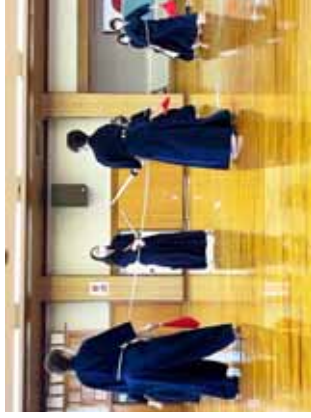
審判員にゴム紐をつけてもらい場所とりの確認