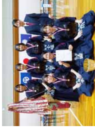
女子団体優勝の敦賀高校

優勝が決まった瞬間、私は嬉しさとともに、やっとスタートラインに立てたという安堵の気持ちでいっぱいになり、先生、部員と喜びを分かち合いました。それは、2年前、全国大会で勝ち上がりたいという気持ちで丸岡高校剣道部に進み、日々きつい稽古に励んだ中で、どうしても手に入れない切符だったからです。