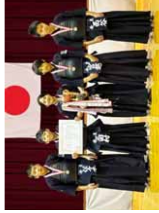
準優勝の福井今立道場A