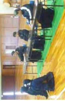
立ち合いの講評を聞く審査受講者①