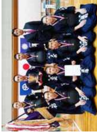
男子団体優勝の丸岡高校