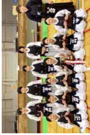
女子の部優勝の中央中学校

「令和5年度 福井県剣道大会(高校)兼福井県高等学校冬季剣道選手権大会兼全国高校選抜大会予選会」が1月21日(日)、福井県立武道館で開催され、男子は丸岡高校、女子は敦賀高校が優勝し、3月26日(火)から愛知県春日井市で開催さ