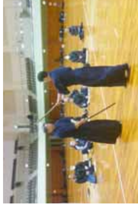
日本剣道形の講習③