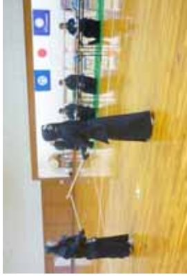
審査受講者による模擬立ち合いの様子②