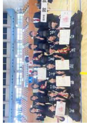
男女ともに準優勝の敦賀高校

北信越各県の代表が集う本大会は、私たち高校剣士にとって最も楽しい大会でもあります。そのような中、一戦一戦、攻める気持ちを貫き、集