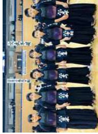
敢闘賞受賞の福井養正館