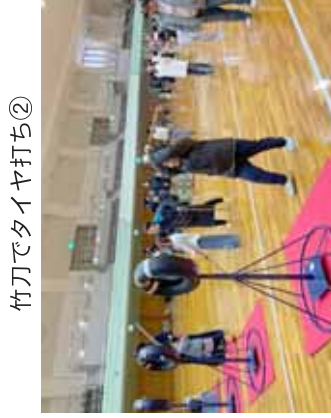
竹刀でタイヤ打ち②