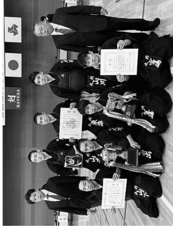
優勝の丸岡高校男子