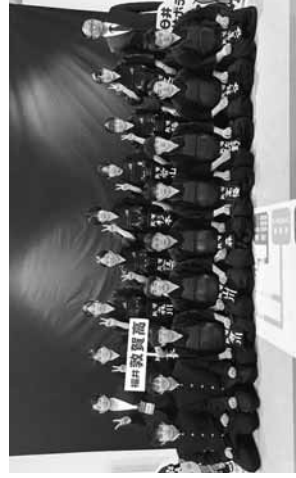
敦賀高剣道部 女子はベスト16