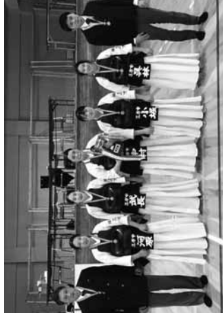
女子団体優勝の三方中学校女子