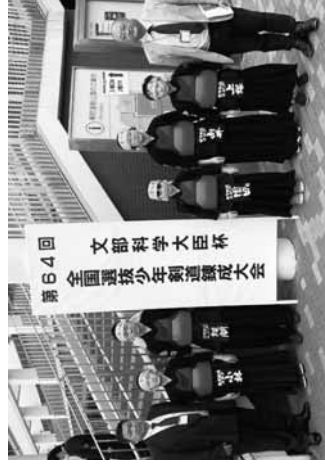
敦賀市剣道スポーツ少年団