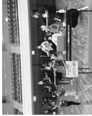
剣道エクササイズ

剣道競技は、福井県剣道連盟普及部が、剣道エクササイズ、木刀で新聞切り、竹刀でタイヤ打ちのコーナーを設けました。各コーナーに長い行列ができる賑わいで、1歳から50代まで、親子ら403名の方々に剣道の魅力に感じていただきました。