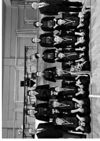
男子団体優勝の松陵中学校男子