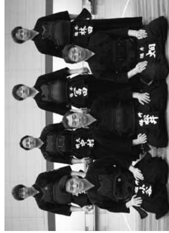
第71回全日本都道府県対抗剣道優勝大会福井県代表選手