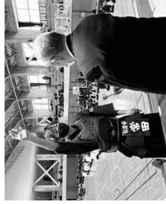
入賞の松陵中学校常務委員和太朗君の宣誓式