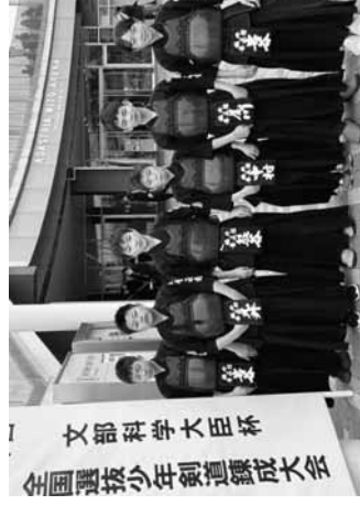
福井養正館チーム