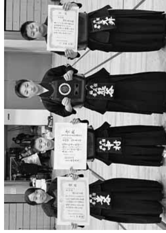
準優勝の福井養正館