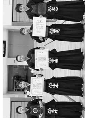
準優勝の福井養正館