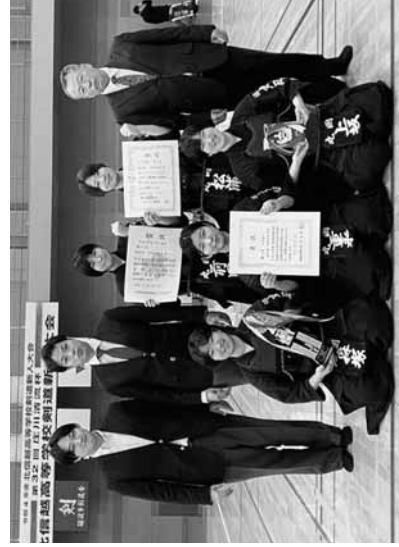
3位入賞の丸岡高校女子