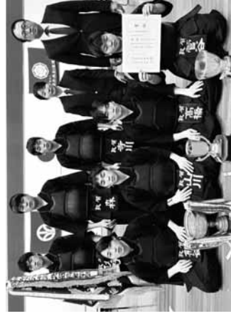
優勝の敦賀高校女子