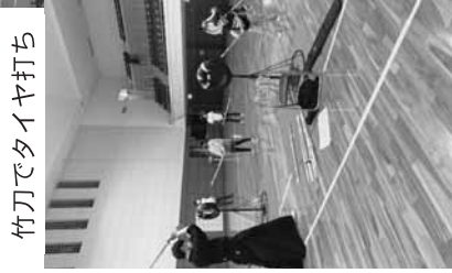
竹刀でタイヤ打ち