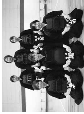
第15回全日本都道府県対抗女子剣道優勝大会福井県代表選手